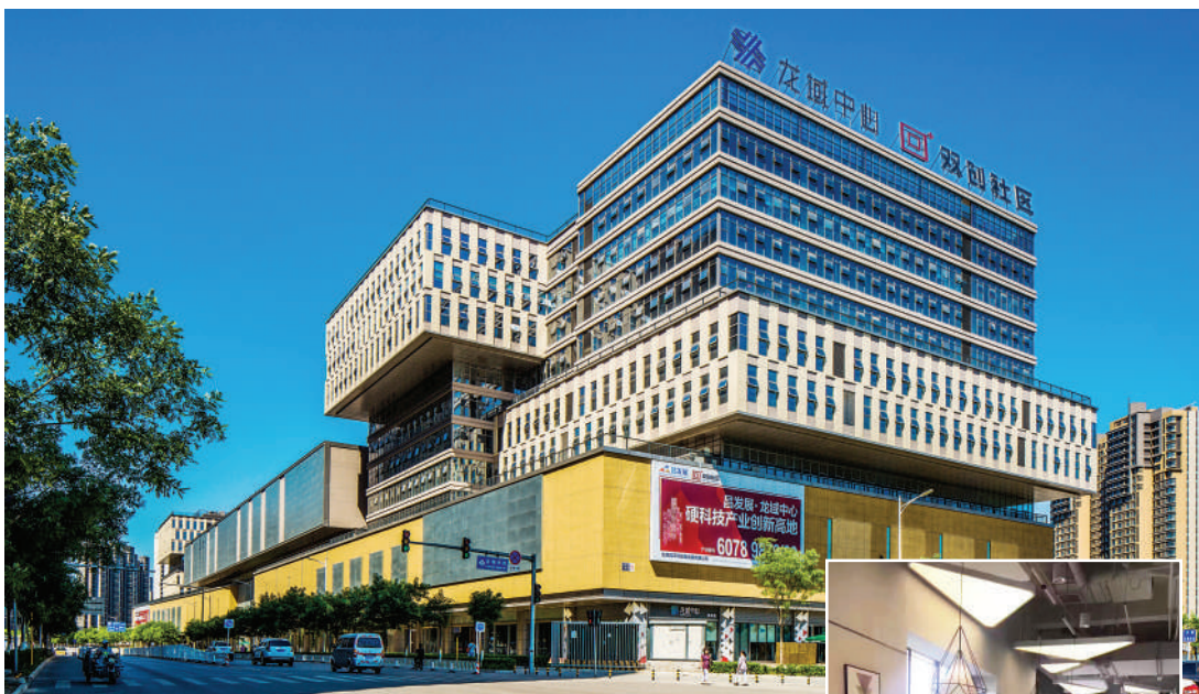
龙域中心外景及内部办公环境

月,昌发展与印力北京城市商业公司进行合作,双方将在龙域中心携手打造创新体验式购物中心——昌发展万科广场。作为商业配套,昌发展万科广场将被打造成为一座“创新体验式社区购物中心”,成为互联网精英们青睐的智能化创新体验式商业空间。